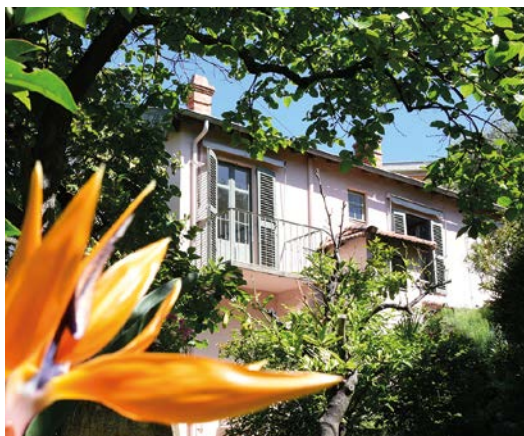
« Le Bosquet » : maison-atelier de Pierre Bonnard au Cannet

Le Bosquet suscite peut-être, le renouvellement stylistique de l'artiste dans sa dernière période. Revenant inlassablement sur les thèmes qui lui sont chers (terrasse et jardin, fenêtre ouverte sur le paysage, natures mortes, salle de bain, femme nue à sa toilette, plans décalés, miroir où le réel est recomposé...), Bonnard travaille sur les mécanismes de la perception et de la vision.